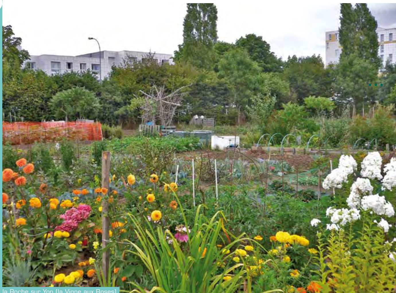
la Roche sur Yon (la Vigne aux Roses)