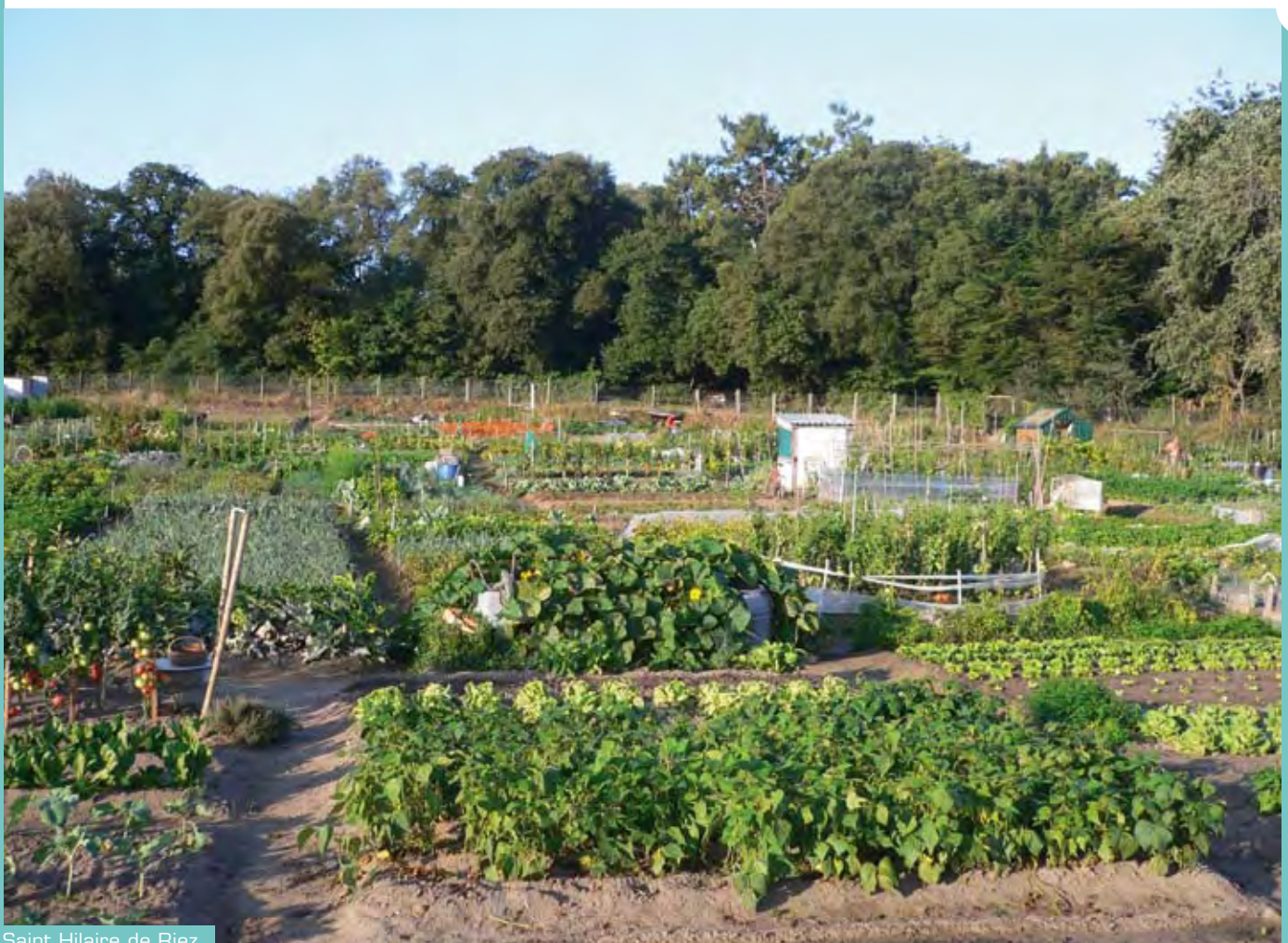
Saint Hilaire de Riez.