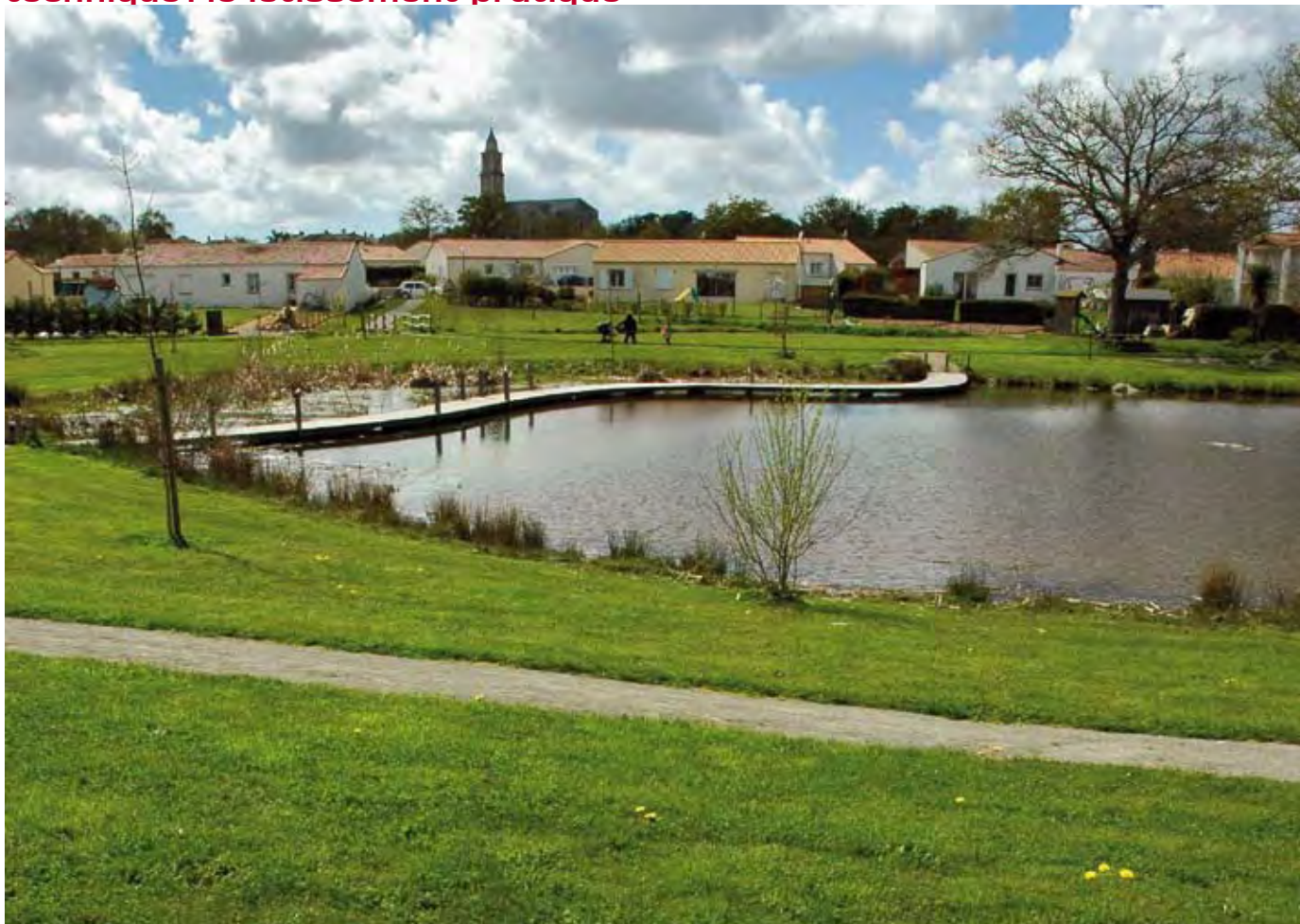
Une zone humide valorisée à proximité d'un quartier d'habitations (la Boissière des Landes, Les Etangs). Remarquez les végétaux adaptés mis en place : joncs, massettes, saules...